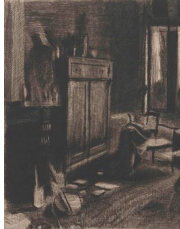
6. Jozef Van Ruyssevelt, Vue de l'atelier , 1979 Eau-forte, 498 x 397 mm