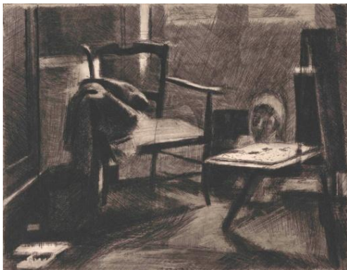
7. Jozef Van Ruyssevelt, La chaise , 1979 Eau-forte, 341 x 443 mm