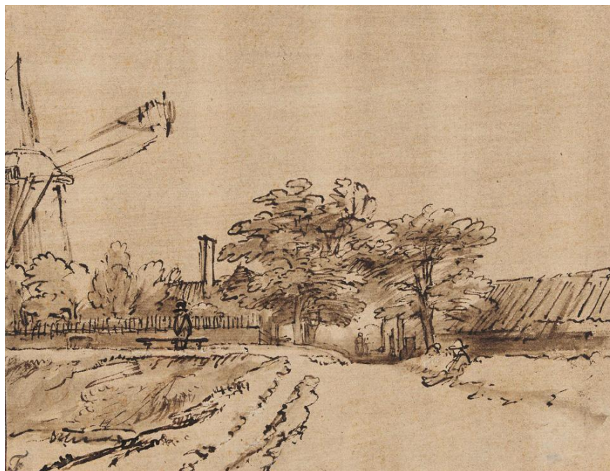
Rembrandt Harmensz. van Rijn, Rempart près de la St. Anthonispoort à Amsterdam, vers 1648-1652

Plume et encre brune, lavis brun, 142 x 182 mm