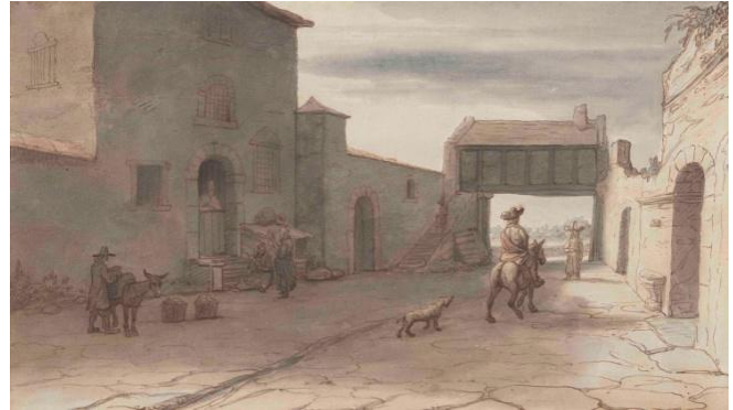
11. Lambert Doomer (1624-1700) Vue du quartier du Vertais à Nantes Plume et encre brune, lavis brun et gris, 289 x 414 mm