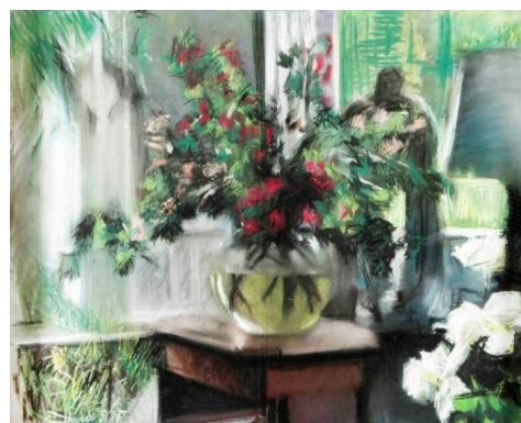
10. Jozef Van Ruyssevelt, Bouquet dans un bocal , 1981 Pastel, 80 x 100 cm