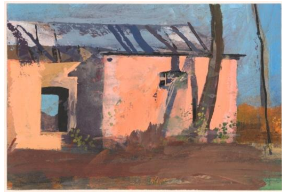
4. Jozef Van Ruyssevelt, Maison solitaire Gouache, 170 x 250 mm