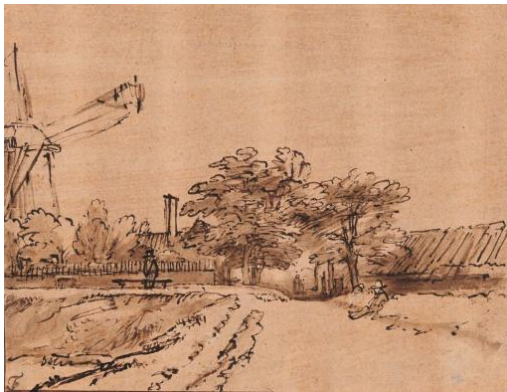
1. Rembrandt Harmensz. van Rijn (1606-1669) Rempart près de la St. Anthonispoort à Amsterdam, vers 1648-1652 Plume et encre brune, lavis brun, 142 x 182 mm