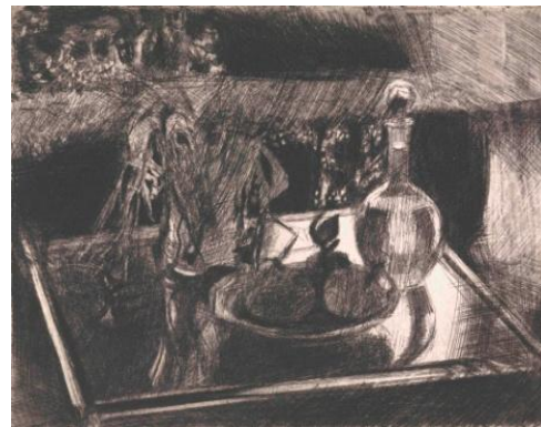
8. Jozef Van Ruyssevelt, Verre sur verre , 1980 Eau-forte, 434 x 557 mm © Rijksmuseum, Amsterdam