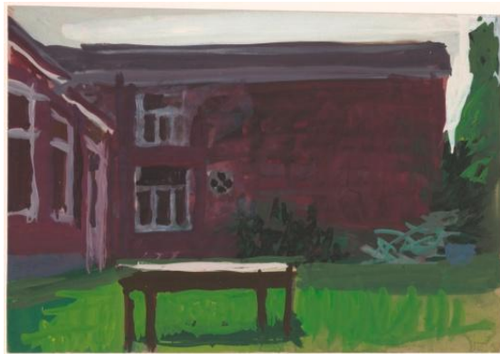
3. Jozef Van Ruyssevelt, Dans la cour Gouache sur papier gris-bleu, 247 x 363 mm