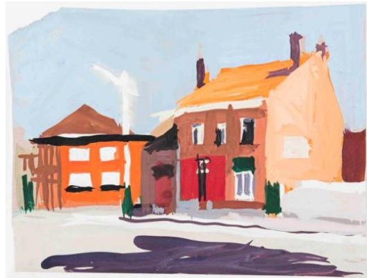
2. Jozef Van Ruyssevelt, Maisons à Essen , 1976 Gouache, 255 x 340 mm