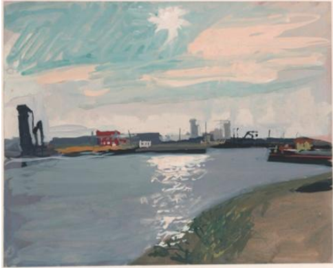
5. Jozef Van Ruyssevelt, Soleil blanc au-dessus du port d'Anvers , 1976 Gouache sur une esquisse au graphite, 276 x 341 mm