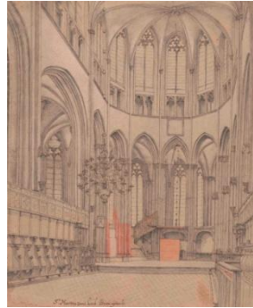
6. Pieter Saenredam (1597-1665)