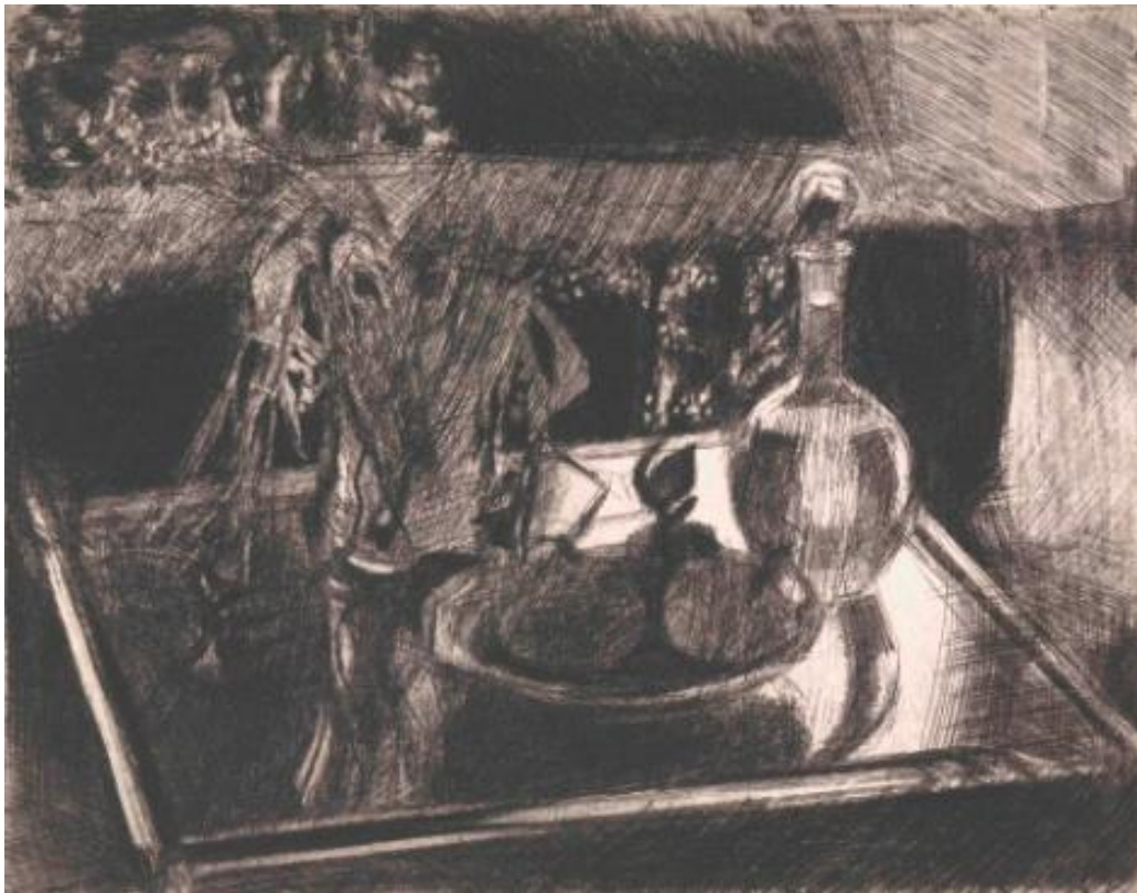
Jozef Van Ruyssevelt, Verre sur verre , 1980 Eau-forte, 434 x 557 mm