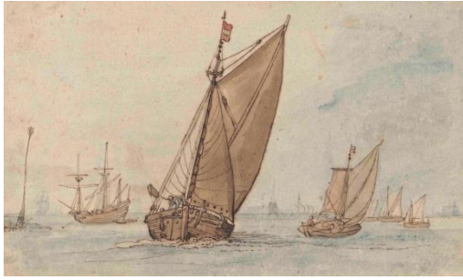
5. Hendrick Avercamp (1585-1634)