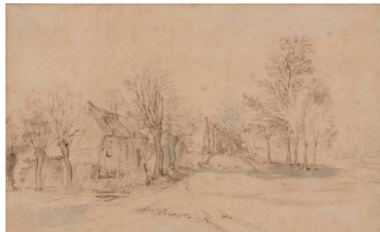
4. Jan Brueghel I (1568-1625) Ferme dans un paysage boisé Plume et encre brune, traces de lavis bleu et brun, 170 x 276 mm