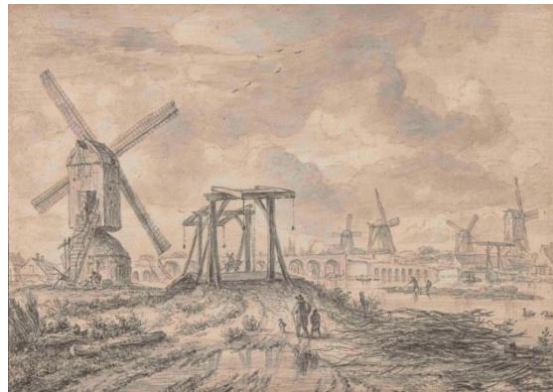
2. Jacob van Ruisdael (1628/29-1682) Vue du pont de l'Amstel (Hogesluis) à Amsterdam, vers 1663 Pierre noire et lavis gris, 150 x 210 mm