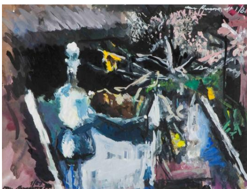
9. Jozef Van Ruyssevelt, Verre sur verre , 1981 Gouache, 540 x 710 mm