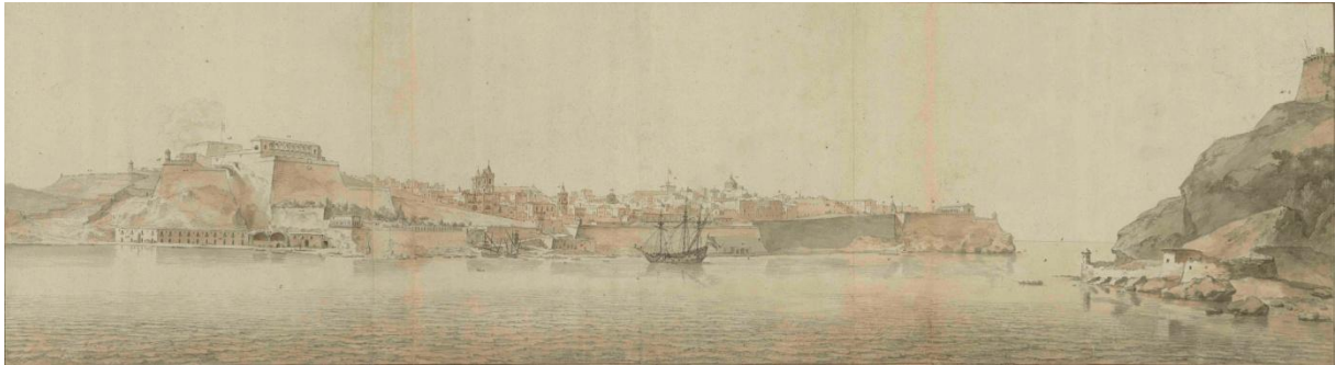
7. Willem Schellinks (1627-1678)

© John and Marine van Vlissingen Art Foundation