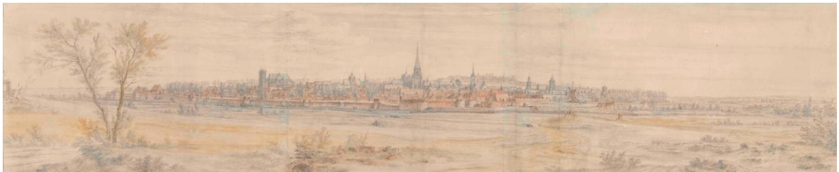
12. Adam Frans van der Meulen (1632-1690) Vue panoramique de Cambrai Aquarelle bleue, ocre et jaune, sur un tracé à la pierre noire, 325 x 1059 mm